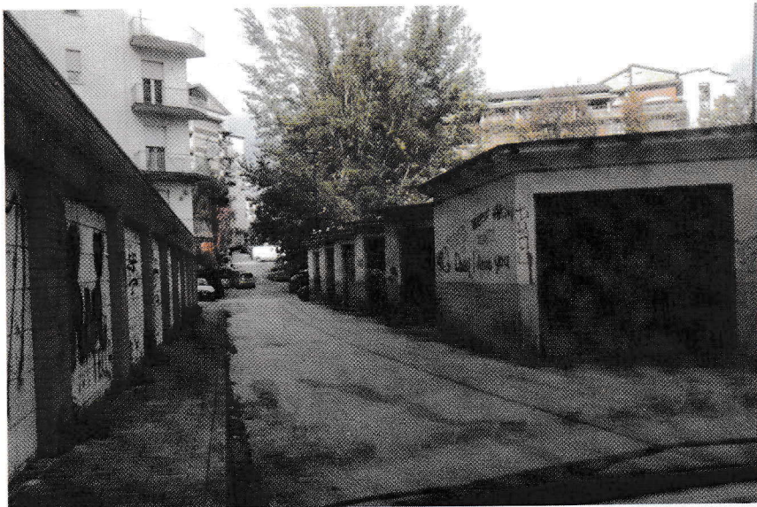
Via delle Fontanelle